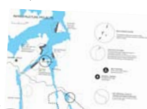
TRANSBORDERKIRKENES, HOVEDOPPÅVAV AV HANS JØRGEN WETLESEN OG ØYSTEIN RØD, NTNU, VÅR 2006

Diplomprosjekter på nettet www.transborderkirkenes.net www.hallsteinguthu.com www.protourban.com